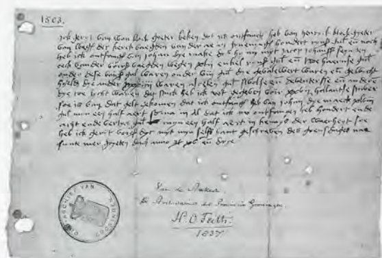
2 Op woensdag na St. Margriet 1503 verklaart Geryt van Wou dat hij geld van de voogden van de Der Aa-kerk heeft ontvangen, zij het dat hij zich beklagt over de kwaliteit van de hem gezonden guldens.

Van de klokken in Kloosterburen en 't Zandt, die in het vervolg van dit artikel een belangrijke rol spelen, werden de diameter en de slaglijn (de afstand van de schouder tot de onderrand van de klok) gemeten en de klankanalyse gemaakt 15 .