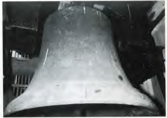
4 De Stephanusklok in Kloosterburen. Geert van Wou heeft de klok in 1501 voor de toren van de Der Aa-kerk gegoten.

Dankzij speurwerk van Nic. Adema te Westbroek is onlangs meer bekend geworden over de lotgevallen van de klok in Borger 16 . In het Gemeentearchief van Borger vond hij een brief van J. Westra van Holthe, gedateerd 20 juni 1936 17 . Uit deze brief blijkt dat de klok van Borger is gebarsten en dat de Gemeente Borger het voornemen heeft de klok te laten vergieten. Westra van Holthe wil alles in het werk stellen om tenminste de klok te behouden: "Er is al genoeg waardevols in vroegere tijden uit de kerken en torens verdwenen." Hij komt vervolgens met tal van suggesties om de klok al dan niet functioneel te behouden en is zich er zeer van bewust dat de Borgerder klok een bij-