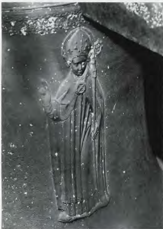
5 Reliëf op de flank van de klok in 't Zandt, met een afbeelding van de H. Nicolaas.

+ lauda martinum quotiens pulsor rogo sanctum gerhardus de wou me fecit anno domini mccccci (Prijs de heilige Martinus, vraag ik (U), zo vaak ik word geslagen. Gerhard van Wou maakte mij in het jaar des Heren 1501).