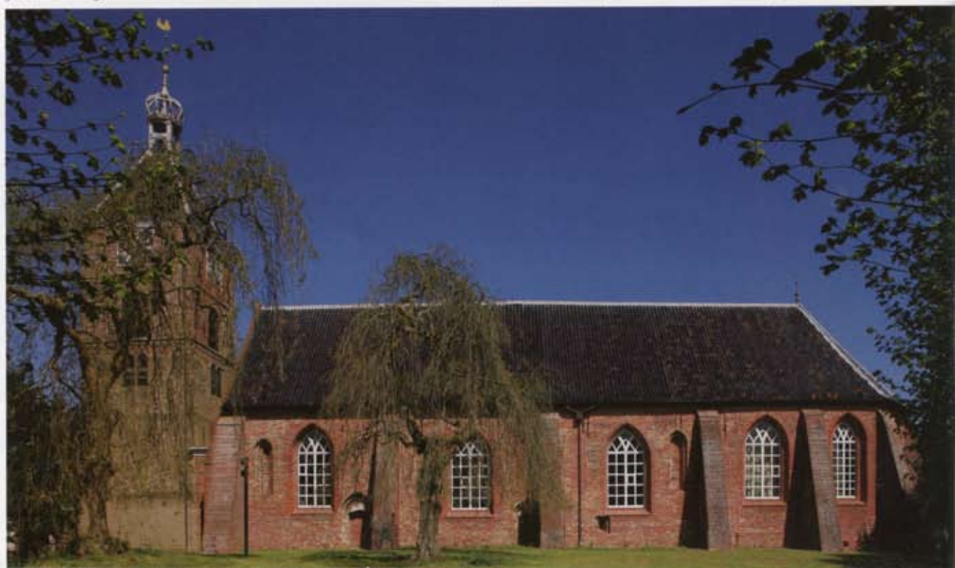
3 Kerk en vrijstaande toren uit het zuiden. Het drie traveeën tellende schip dateert uit de 13e eeuw, het koor uit de 15e eeuw.