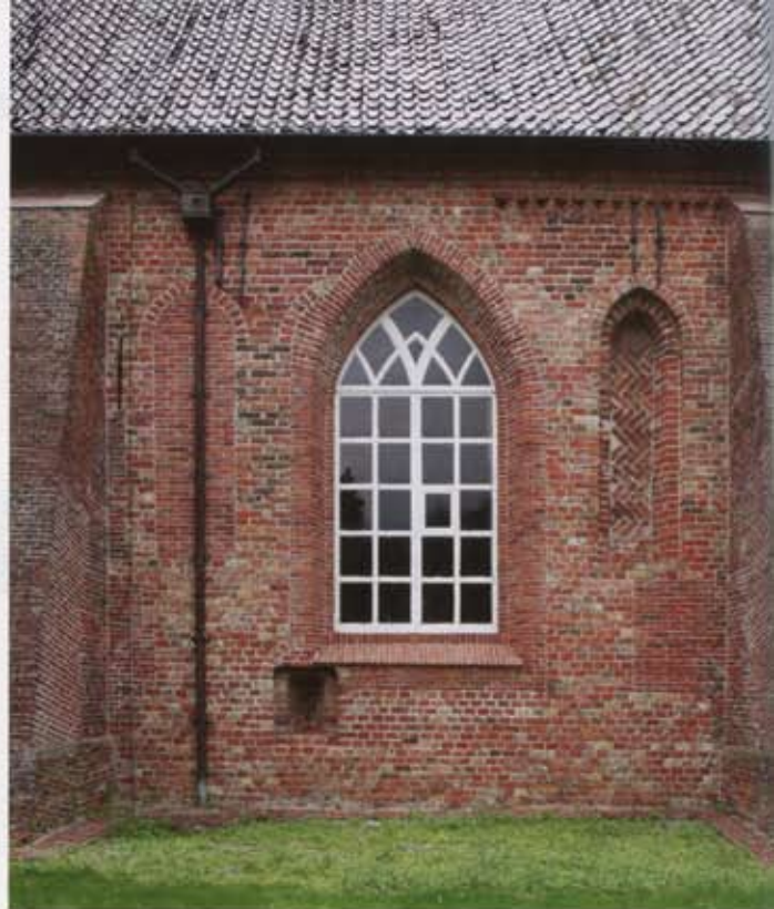
6 Zuidgevel van de oostelijke schiptravee met een laag venster en een nis met siermetselwerk. Boven deze nis een restant oorspronkelijk metselwerk, beëindigd door een overhoekse muizentand.

Van de dertiende-eeuwse kerk zijn de drie westelijke traveeën bewaard. Deze werden uitwendig door lisenen gescheiden. Elke travee bevatte in de langsgevels twee smalle spitsbogige vensters, telkens geflankeerd door twee smalle spitsbogige nissen met siermetselwerk. Het valt op, dat de vensteropeningen en de nissen niet door rondstaven worden begeleid. Bij de restauratie is evenwel in een later beklampt deel van de muur het restant van een dagkant