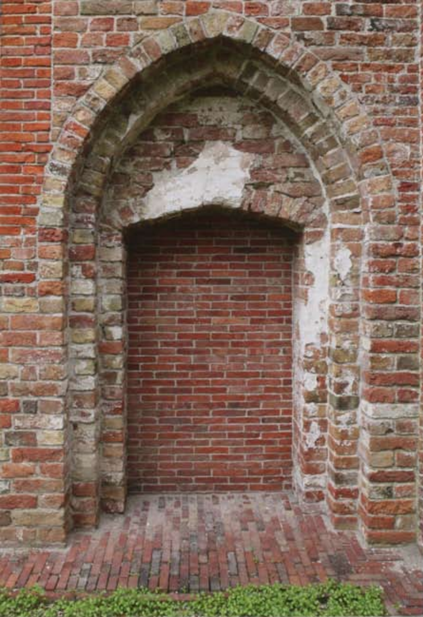
5 Gedicht portaal in de zuidgevel van de westelijke schiptravee met restanten van oud pleisterwerk.

verband van twee of drie strekken en een kop. Voorts zijn in de derde travee hoog aan de zuidgevel ter weerszijden van het venster nog resten origineel metselwerk te onderkennen. Voor het overige zijn de gevels uitgevoerd in afbraaksteen in groot formaat en met overmatig veel koppen, alsook op een aantal plaatsen hersteld met een beklamping van kleinere steen in kruis- of in strekkenverband.