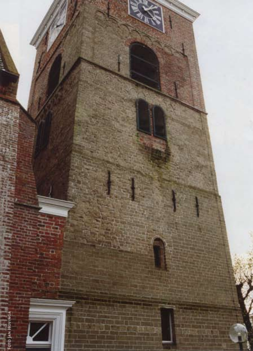
2 De noordgevel van de toren, gezien uit het noordoosten. De aan de hogere geledingen resterende oude tufsteen is lichter getint dan de bij de restauratie beneden aangebrachte nieuwe tufsteen. De derde en vierde geleding worden door een gekruist respectievelijk een enkelvoudig rondboogfries afgesloten.

dus beperkt zijn geweest. Aan de noord- en oostzijde van de toren is de tufstenen bekleding van oude datum nog ten dele bewaard; aan de zuid- en westgevel is zij vanwege de als slecht beoordeelde kwaliteit bij de restauratie vrijwel geheel vervangen. 3 Een belangrijk deel van de bakstenen is daarentegen voor de eerste maal gebruikt, niet van afbraak afkomstig en in voortreffelijke staat. Ze zijn in een tamelijk regelmatig verband van twee, soms drie strekken en een kop gemetseld.