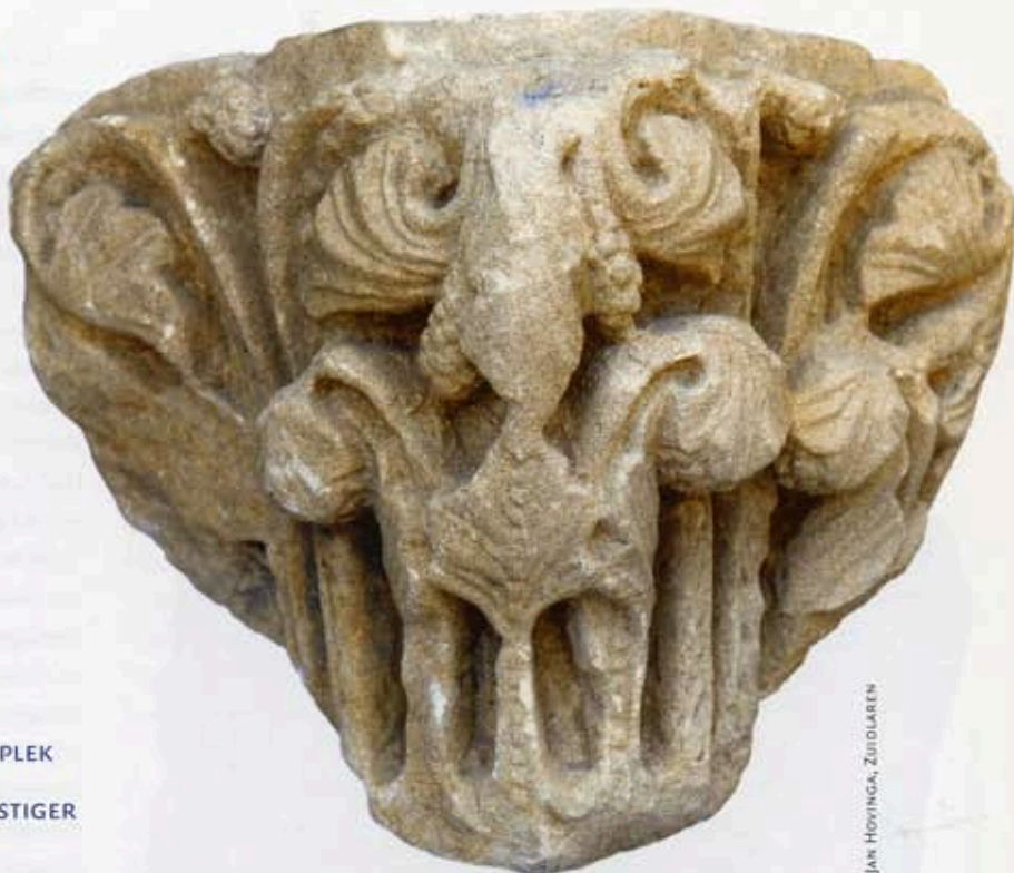
1 Kapiteel uit Thesinge, gezien over de linkerhoek

De kerk van Thesinge is het enige overblijfsel van het klooster dat hier volgens de traditie op het eind van de twaalfde eeuw was gesticht, ook al dateert de oudste zekere vermelding pas van 1283. 2 De oudste delen van het huidige gebouw worden in het midden van de dertiende eeuw gedateerd. 3 Het is de verlaagde koortravee met halfronde sluiting, die in 1786 werd gespaard bij de sloop van de rest van het bouwwerk, dat ruim veertig meter lang moet zijn geweest.