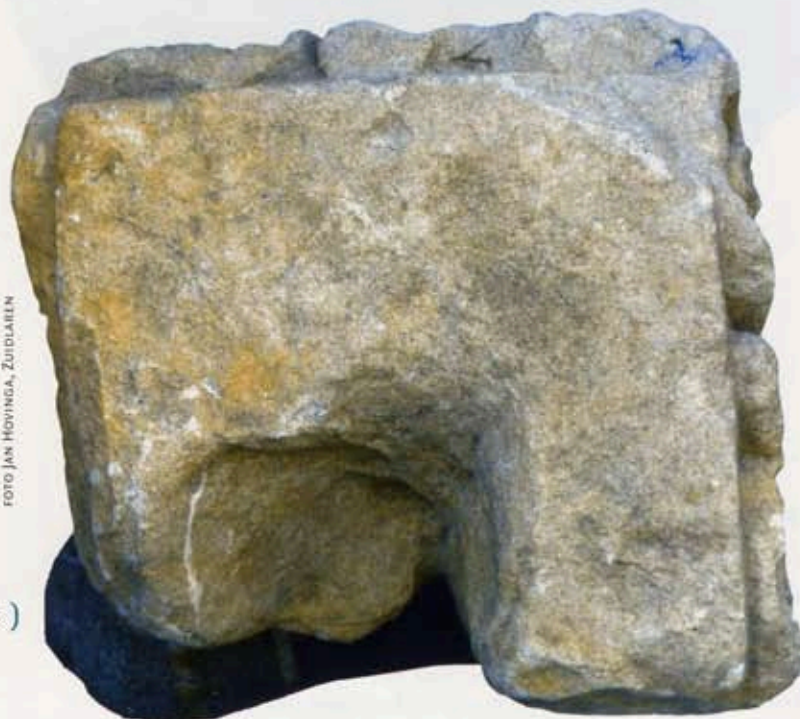
2 Kapiteel uit Thesinge, bovenzijde

details in het opgaande werk die op een aanbouw wijzen. Bij kleinere kloosters, zoals dat van Thesinge, dat bovendien niet erg voorspoedig schijnt te zijn geweest, kwam het vaak niet tot de uitbouw van een volledig kloostergebouw in carré-vorm. Een kloostervleugel aan de noordzijde lijkt op grond van deze bevindingen de meest waarschijnlijke situatie. Hoewel in het algemeen de zuidzijde de voorkeur had, heeft in dit geval mogelijk de gesteldheid van het terrein tot deze minder gebruikelijke oplossing geleid.