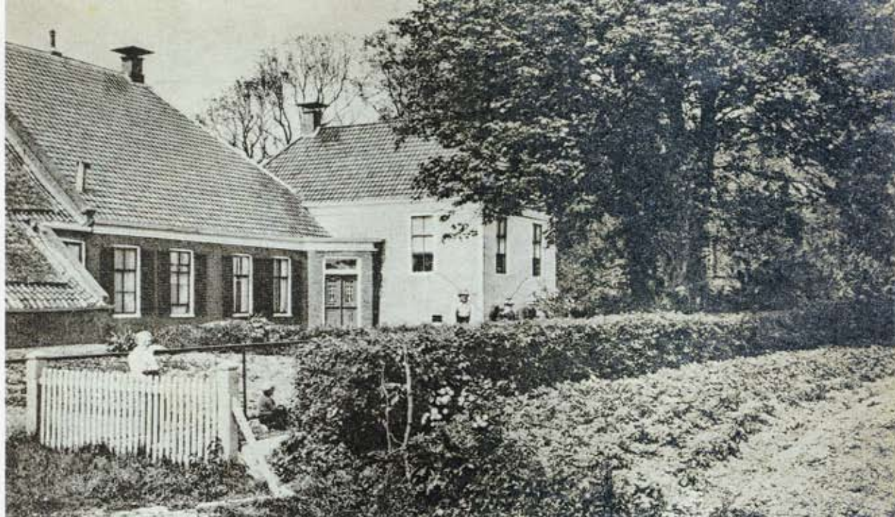
De weem in 1926.

werd de zaal groen geverfd en verlakt en in april 1834 werd er een nieuwe zolder onder de stenen zolder op de studeerkamer gelegd. In 1835 zijn er nieuwe ramen in de zaal aangebracht en één nieuw venster in de studeerkamer. Op 27 april 1839 werden de zware schoorsteenpijpen afgehakt, "die levensgevaarlijk waren" en werden er nieuwe geplaatst. Het dak van de pastorie was in die tijd ook slecht. Toen de kerovoogdij plannen maakte om de toren te verbouwen, protesteerde ds. J.B. Snoek, bewoner van het huis van 1826 tot aan zijn dood in 1846 hiertegen. In een geschrift stelde hij dat de kap van de pastorie zo zwak was, dat "de bewoners derzelve telkens bij iederen storm vreezen dat dezelve naar beneden storte". 3 In 1858 werd de pastorie vertimmerd. Zo werd het gehele middengebouw vernieuwd, evenals de ramen in de studeerkamer en de kap van het dwarshuis. Het huis werd ook bepleisterd. Wellicht had het oude huis oorspronkelijk topgevels die mogelijk bij deze verbouwing werden verwijderd. Het neoclassicisme had immers een zekere voorkeur voor wolf- en schilddaken.