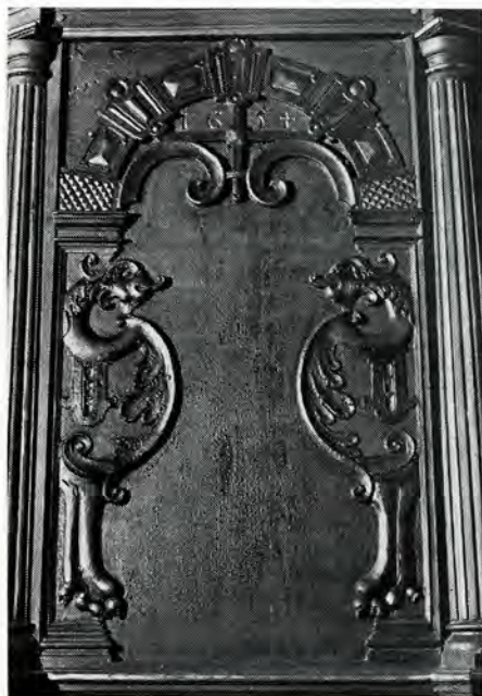
afb. 4. Eenum. Ned. Herv. kerk. Preekstoel, midden-paneel, 1654.

Bij de preekstoel te Eenum uit 1654 is de halffiguur niet een vrouw, maar een slangachtig monster (afb. 4). Op de stoel in Sappemeer, vermoedelijk uit de bouwtijd van de kerk (1653-'55) zien we vogelkoppen (afb. 5). Op de preekstoel in Bierum, die door Ozinga rond 1650 gedateerd wordt, zijn bovenaan kleine vrouwenbustes en onderaan vogelkoppen uitgebeeld. De preekstoel te Krewerd ( \pm 1650) heeft zowel bovenaan als onderaan monsterkoppen. Op een grote herebank in Godlinze zien we zowel panelen met vrouwenbustes als met bulldog-achtige monsterkoppen (afb. 6). Door Ozinga wordt deze bank in de tweede helft van de 17de eeuw geplaatst.