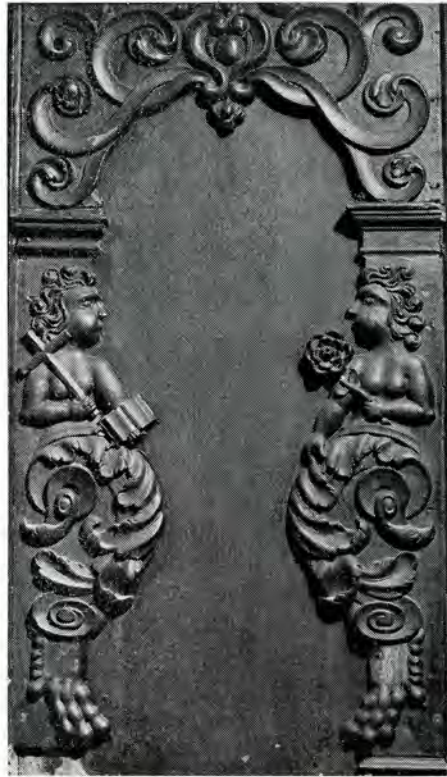
afb. 2. Tinallinge. Ned. Herv. kerk. Preekstoel, tweede paneel: li. Geloof, re. Reuk.

die een vloeistof uit een kan in een kom giet, wat gewoonlijk de Matiging voorstelt, maar in dit verband ook op de Smaak kan duiden. Meestal wordt de Smaak voorgesteld door een vrouw die iets in de mond steekt. We hebben hier kennelijk met een drinkbare vloeistof te maken. Op het vierde paneel is een vrouw met opgestoken vinger te zien, hetgeen hier blijkbaar als beeld van het Gezicht bedoeld is.