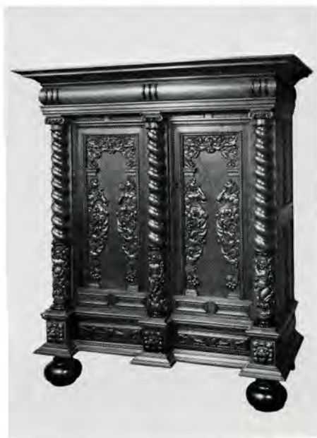
afb. 7. Fries Museum, Leeuwarden. Kast, 17de eeuw: li. paneel Gehoor en Gezicht, re. paneel Reuk en Smaak (v.l.n.r.).

leert dat we hier met groninger kasten te maken hebben. Op de panelen van de kasten zien we dezelfde naar binnen gekeerde vleugelstukken, met bovenaan een halffiguur en onderaan een klauwpoot. De halffiguren zijn op beide kasten allegorische vrouwenfiguren. Op de ene kast (afb. 7) zien we van links naar rechts: vrouw met luit: het Gehoor; vrouw met spiegel waarin zij zichzelf ziet: het Gezicht; vrouw met een bloem bij de neus: de Reuk; vrouw die iets in de mond steekt: de Smaak. Op deze kast zijn dus vier zintuigen uitgebeeld. Op de andere kast zien we: vrouw met beker, hetgeen vaak op het Geloof slaat, maar hier waarschijnlijk de Smaak voorstelt; vrouw met zwaard en weegschaal: de Gerechtigheid; vrouw met bloemenruiker: de Reuk; vrouw met slang en spiegel: de Voorzichtigheid. Op deze kast derhalve twee deugden en twee zintuigen. De kasten vertonen dus niet alleen qua vorm, maar ook qua allegorische voorstellingen een grote overeenkomst met de preekstoel