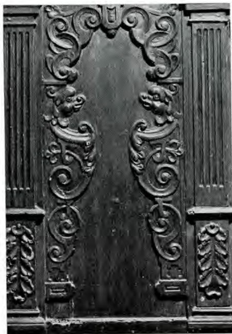
afb. 6. Godlinze. Ned. Herv. kerk. Herebank, bulldog-paneel.

Toen wij de foto's zagen gingen wij twifelen of het hier wel friese kasten betrof. Onze gedachten gingen direct uit naar Groningen en vergelijking met o.a. de preekstoel te Tinallinge