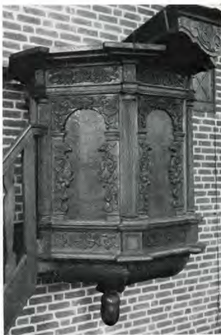
afb. 5. Sappemeer. Ned. Herv. kerk. Preekstoel, verm. 1653-1655.

Tenslotte een drietal preekstoelen en twee herebanken waarbij het snijwerk op de panelen wel qua vorm overeenstemt met de voorafgaande typen, maar niet op een figuratieve voorstelling uitloopt. Het bestaat alleen uit krullen (voluten) en heeft noch bovenaan een halffiguur, noch onderaan een klawpoot. Het zijn de preekstoelen in: Westermiden ( \pm 1650), Oosterwijtwerd (1666) en Lellens (1668); daarnaast nog de herebanken in Zeerijp en Loppersum (beide 17de eeuw). Uitgezonderd die van Zeerijp zijn geen beeldhouwers bekend.