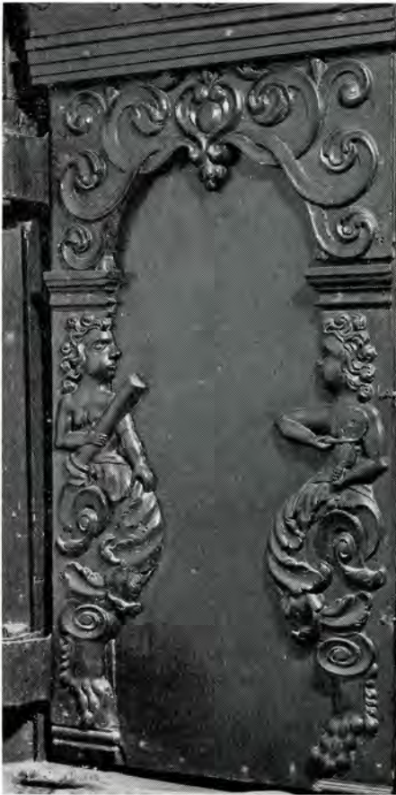
afb. 1. Tinallinge. Ned. Herv. kerk. Preekstoel, eerste paneel: li. Standvastigheid, re. Gehoor.

het deurtje: Standvastigheid (vrouw met zuil), Geloof (vrouw met kruis en boek), Hoop (vrouw met anker en duif), Liefde (vrouw met kind) en Gerechtigheid (vrouw met zwaard en weegschaal). De identifikatie van de rechterfiguren is minder eenvoudig. De eerste is een vrouw met een viool, de tweede een vrouw met bloem. Hier zijn twee zintuigen uitgebeeld, nl. Gehoor en Reuk. Op het vijfde paneel een vogel die met zijn staart de arm van de vrouw raakt: beeld van de Tastzin. Van de vijf zintuigen resten dus nog Smaak en Gezicht, die men logischer wijze verwacht op de twee andere panelen. We zien op het derde paneel een vrouw