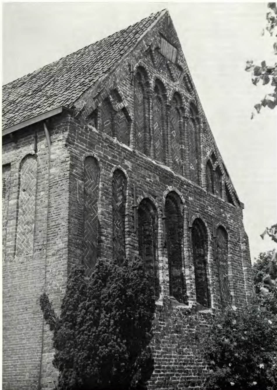
Afb. 4. Westermenden. Koorgevel.