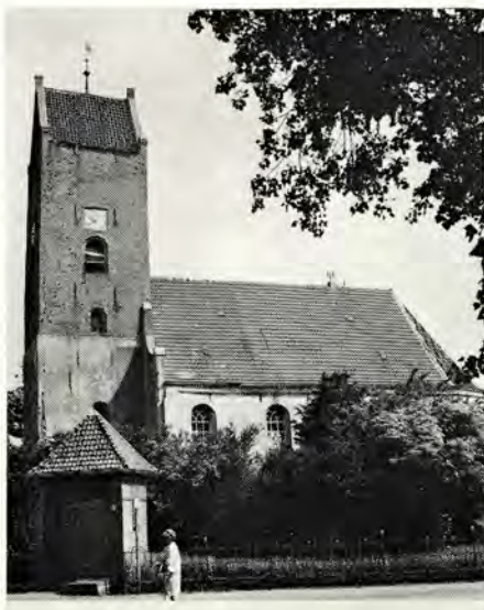
Afb. 5. Garnwerd. Zuidzijde.

De Stichting bezit uit deze periode in de eerste plaats de kerk te VISVLIET, volgens een steen in de westgevel gesticht in 1427. Het is een eenvoudige gotische dorpskerk, die momenteel geheel bepleisterd is. In de muren zijn grote rondboogvensters ingebroken. De kerk te OBERGUM kreeg in de 15de eeuw een nieuw groot koor. In het begin van de 16de eeuw kreeg de kerk te LEEGKERK een nieuw koor en een nieuwe zuidgevel. Voor de 16de eeuw kan voor Groningen verder gewezen worden op het klooster in Ter Apel, waarvan de kerk in 1501 gereed kwam,