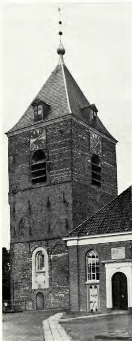
Afb. 1. Uithoorn. Toren zuid- en oostzijde.

de Stichting werd overgedragen. Helaas is in Eenum de absis \pm 1860 afgebroken, terwijl aan de zuidzijde door het inbreken van grote vensters weinig van de oorspronkelijke situatie meer is te zien.