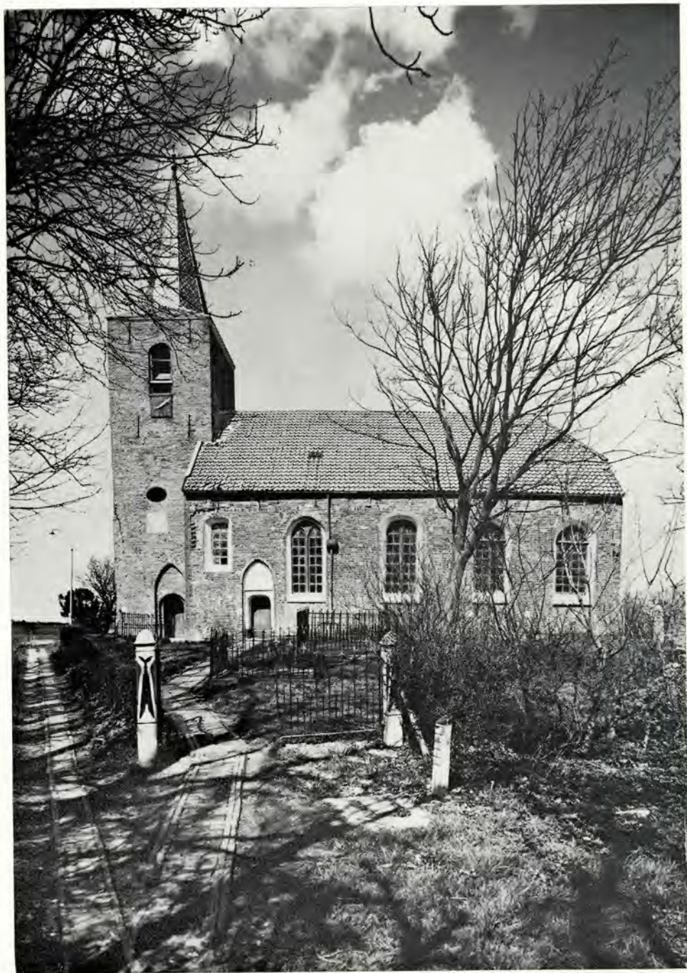
Afb. 2. Eenum. Zuidzijde.