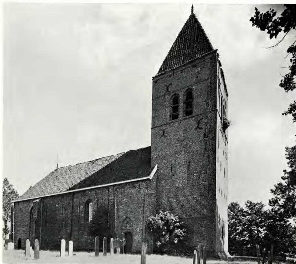
Afb. 3. Westertoren. Noordzijde.

stijlontwikkeling volgend van omstreeks 1225 tot 1350.