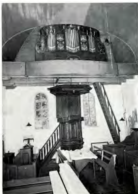
Afb. 4. Oude Schans. Interieur naar de kansel.