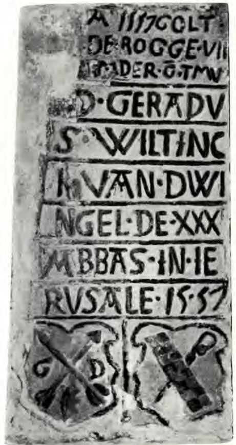
Afb. 5. Visvliet. Gedenksteen met als opschrift: "Anno 1557 golt de rogge VII Emdere gulden tmd. D. Gerardus Wiltinck van Dwingel, de XXX abbas in Ierusalem 1557". Gerard Wiltinck was abt van het klooster Jeruzalem in het naburige Gerkesklooster.

met de Provinciale V.V.V. en de Stichting Groningen Orgelland. De tochten mogen zich in een toenemende belangstelling verheugen; in december 1973 namen bijna 1700 mensen deel aan een tocht langs kerken in de Woldstreek. Men kan bij deze tochten zowel per bus als met eigen auto gaan. In oktober 1969 werd een Romantische Ruïne Rally gehouden langs Leegkerk, Oostum en Obergum; in december 1969 een tocht langs Loppersum, 't Zandt, Zeerijp en Godlinze; in mei 1970 een tocht langs kerken met fraaie preekstoelen in Uithuizen en omgeving; in december 1970