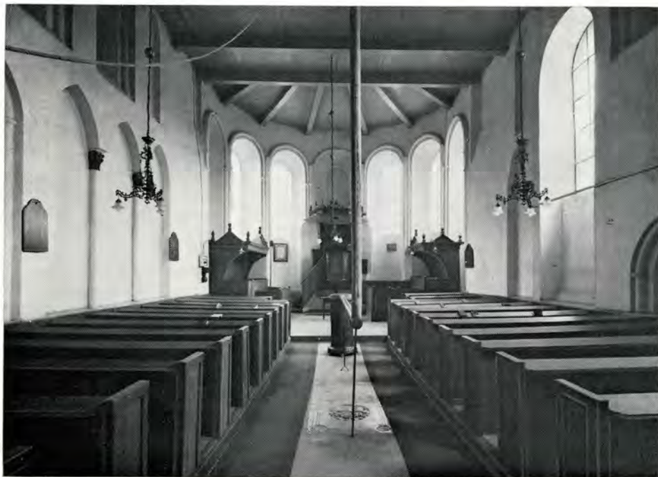
Afb. 1. Thesinge. Interieur naar het oosten vóór de restauratie.