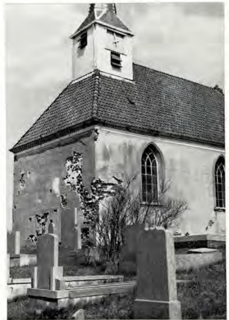
Afb. 3. Stitswerd. West- en zuidzijde.

De eerste vijf jaren van de Stichting kenmerkten zich door een stormachtige groei in allerlei opzichten. In de eerste plaats wat de objekten zelf betreft. In november 1969 werd de toren te Zuidwolde overgedragen, in 1970 de kerken en torens te Obergum, Oostum en Leegkerk, in 1971 de toren te Uitwierde en de kerken en torens te Westerwijtwerd, Midwolde en Thesinge, in 1973 de kerken met torens te Stitswerd, Westermenden, Oude Schans, Eenrum, Garnwerd en Visvliet, in de eerste maanden van 1974 de kerk te Middelbert. De Stichting heeft dus nu 15 grote monumentale gebouwen te beheren. Met verschillende kerkvoogdijen worden onderhandelingen gevoerd en aan het einde van dit jaar zullen waarschijnlijk reeds 20 kerken eigendom van de Stichting zijn. Aan elke overname gaan vele besprekingen vooraf, met name ook over het