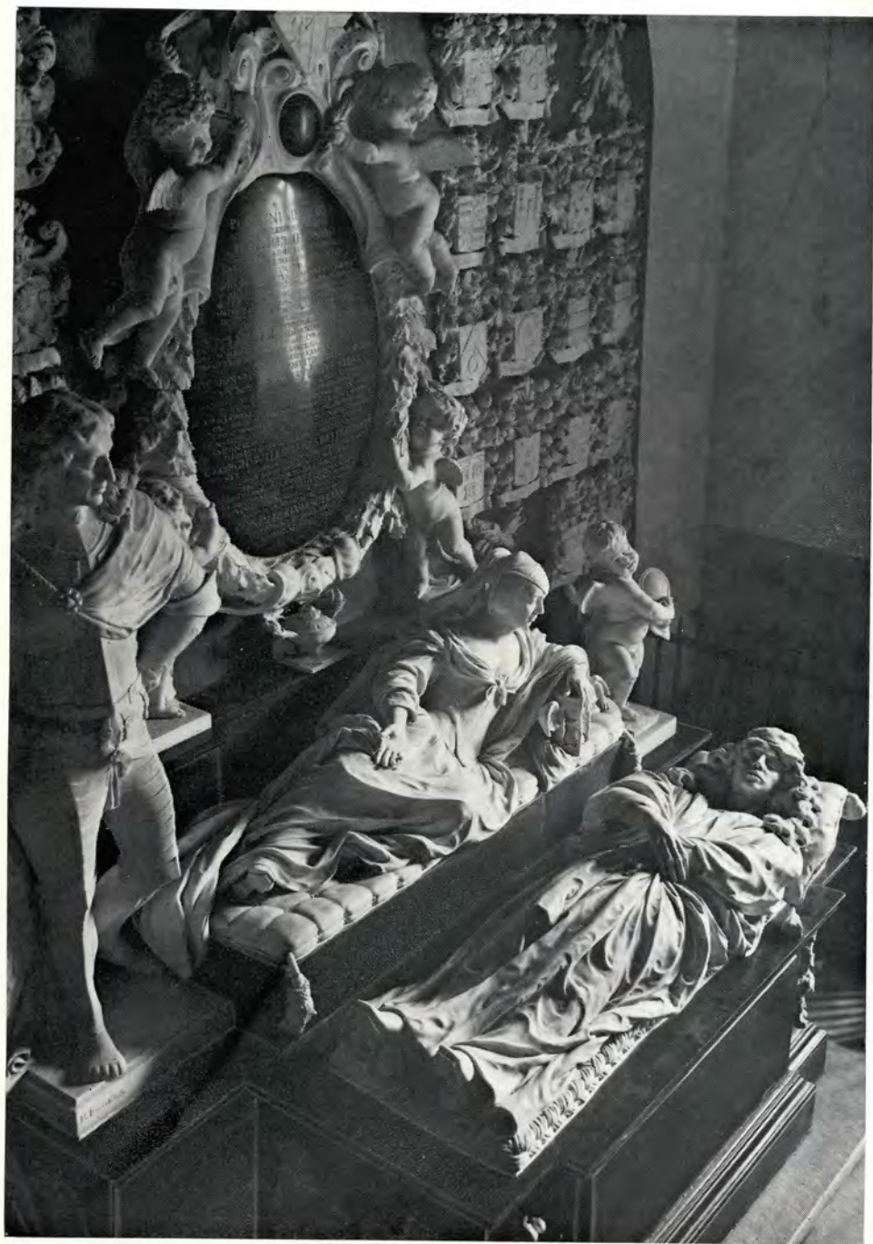
Afb. 6. Midwolde. Grafmonument van Rombout Verhulst (1665-'69) voor Carel Hieronymus Baron van Inn- en Knyphuizen. In het midden diens vrouw Anna van Ewsum en links haar tweede man Georg Wilhelm van Inn- en Knyphuizen. Dit laatste beeld werd gemaakt door Bartholomeus Eggers in 1714.