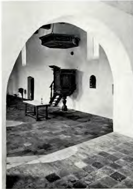
Afb. 2. Leegkerk. Interieur van het koor naar de kansel.

loop van de kronkelige binnenwegen zo markant begeleiden, zijn ontbladerd. De onafzienbare akkers zijn leeg; ze liggen in afwachting van de winter en daarna van opnieuw een voorjaar. Boerderijen liggen er als burchten met achter zich de kathedralen van hun schuren. Vaak is er een zachte glooiing van een terp, van een wierde, die, afgegraven en wel, nog de middeleeuwse kerk draagt. Die kerken zijn in Groningeland mooi, zoals ze in het aangrenzende Friesland, dat èn verwantschap èn verschillen met Groningen heeft, ook dikwijls mooi zijn. Te individueel mooi om waar te zijn in deze tijd waarin zoveel is gladgestreken en de funktie van al die kerkjes er niet duidelijker op is geworden. Je kunt die bekende uitspraak overigens ook omkeren: vele kerkjes zijn te waar om allemaal nog mooi te zijn. Juist omdat de bedehuisen weinig funktie hebben, glijden ze niet alleen figuurlijk, maar letterlijk uit het leven van alledag weg. Er zal ook in Groningen nog veel moeten worden hersteld als behouden zal worden, wat