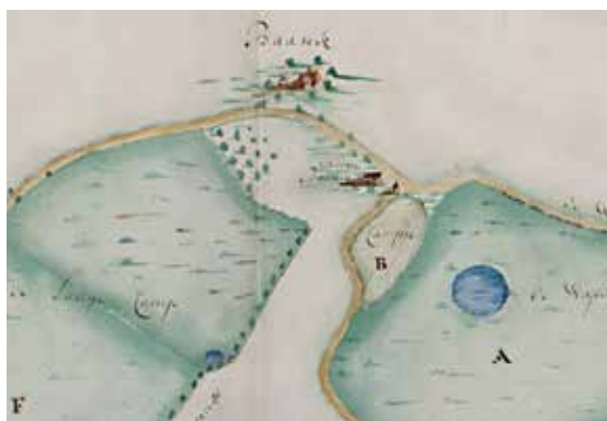
Uitsnede van de kaart 'De Wapsumse Landen' van 1723, getekend door I. van Heuvel, met daarop de boerderijen Baank en Kleyn Baank.

Alleen op de kaart van 1723 staan boerderijen afgebeeld. Het zijn er twee tussen De Lange Camp en De Wapse, aan weerszijden van wat dan de Windheuvelstraat heet – nu