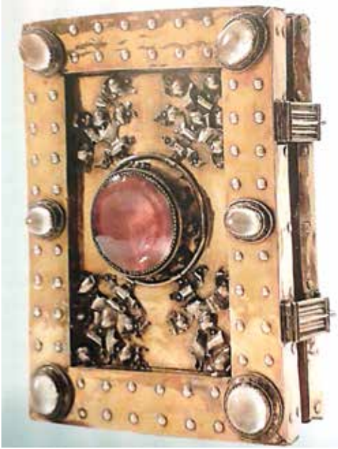
Afb. 2 Het Liber Aureus Zutphaniensis . Parochie Sint-Jan de Doper, Zutphen. Bruikleen Stedelijk Museum Zutphen, inventarisnummer Br 00026.