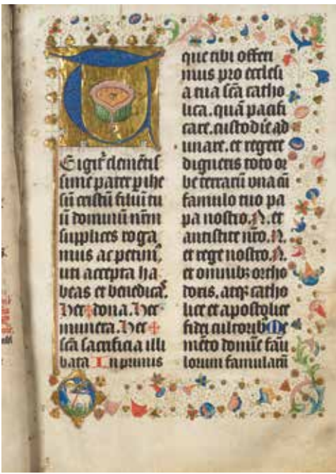
Afb. 5. Missaal geschreven voor het klooster Isendoorn Zutphen. CLZ nr. 3.

pittelbibliotheek zijn wel boeken uit het bezit van enkele kapittelheren en een burgemeester in de nieuwe librerie terechtgekomen.