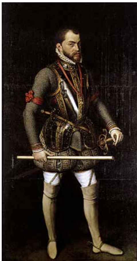
Koning Philips II van Spanje (1527-1598) geschilderd door Antonio Moro.

Zutphen ontvangt de verordeningen uit Brussel via het Hof van Gelre in Arnhem in de vorm van brieven en plakaten. Plakaten zijn open brieven, gericht aan de bevolking, die op openbare plaatsen moeten worden