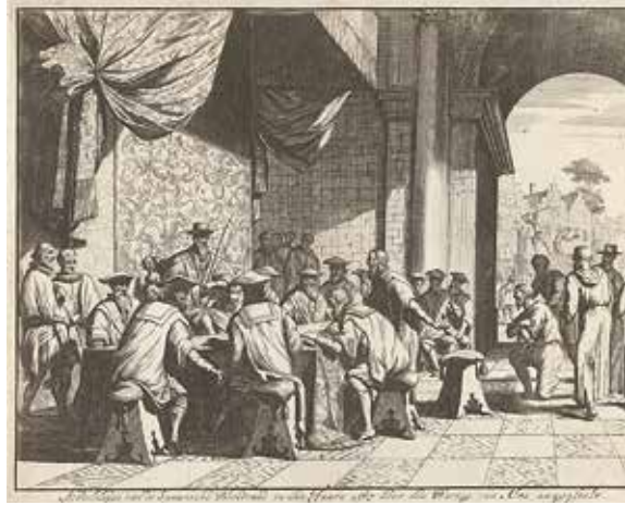
Zitting van de Raad van Beroerten – door het volk 'Bloedraad' genoemd – met aan het hoofd Alva.

Deze gang van zaken stuit op weerstand van de lokale en gewestelijke bestuurders. Hun privileges op het gebied van de rechtspraak worden terzijde geschoven en veel autoriteiten zijn het niet eens met het vervolgingsbeleid van Brussel. Ze keuren de praktijken van de 'dwalende katholieken' weliswaar af, maar