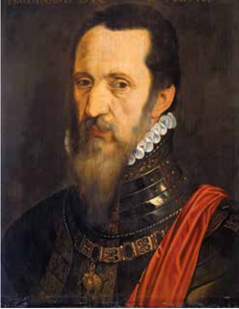
Fernando Alvarez de Toledo, hertog van Alva (1507-1582).

mensen toch al armoede en honger lijden. Daarom vraagt Doetinchem begin 1571 aan de stadhouder om de soldaten te verwijderen, omdat de bevolking financieel geruïneerd wordt.