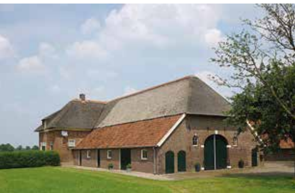
De boerderij Geessink in de buurtschap Warken bij Warnsveld anno 2014.