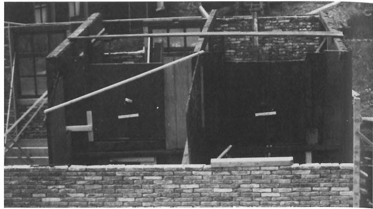
Bij herbouw van een pand werd meestal eerst de houten binnenbetimmering geplaatst; daar omheen werden de muren gemetseld of de muurfragmenten gezet. Hier de herbouw van een pand uit Hoorn, waar eerst de tussenwand en bedstedewand waren geplaatst, 1973.

Ten behoeve van de restauratie van de overgebrachte huizen moest een voorraad van verschillende soorten stenen, tegels, dakpannen, plaveisel, oud hout, deuren en kozijnen worden aangelegd. In de eerste jaren van de opbouw van het museum is veel tijd en aandacht besteed aan het verzamelen van deze materialen: een museummedewerker ging op pad om partijen van dit steeds schaarser wordende bouw materiaal bij slopers op te kopen. Zo kon het museum een goede voorraad opbouwen van steeds schaarser en kostbaarder wordende materialen. Tijdens het bouwen van het museum werd die voorraad regelmatig aangevuld. Dankzij het feit dat reeds in een vroeg stadium was begonnen met het verzamelen van oude bouwmaterialen en architectuurfragmenten kon het museum gedurende het hele bouwproces zo goed als zonder problemen doorgaan met het restaureren van de huisjes. Bij de restauratie werd er van uitgegaan dat er zoveel mogelijk oorspronkelijk materiaal werd gebruikt. Daarom werden zo veel en zo groot mogelijke fragmenten overgebracht – hele wanden, bedschotten, enzovoorts – omdat was gebleken, dat hoe groter de overgebrachte onderdelen, hoe meer oorspronkelijk materiaal behouden kon blijven. Bovendien bevatten deze grote fragmenten vaak aanwijzingen over vroegere verbouwingen: tot ongeveer 1950 werd er bij een verbouwing zo zuinig met het afkomende hout omgesprongen, dat bijna alles opnieuw werd gebruikt.