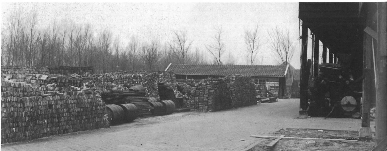
Achter de opslagloods werd de voorraad oude stenen en dakpannen bewaard, 1976.