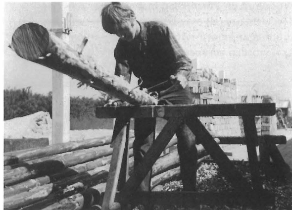
Het schillen van de daksparren voor de boerderij uit Zuiderwoude.