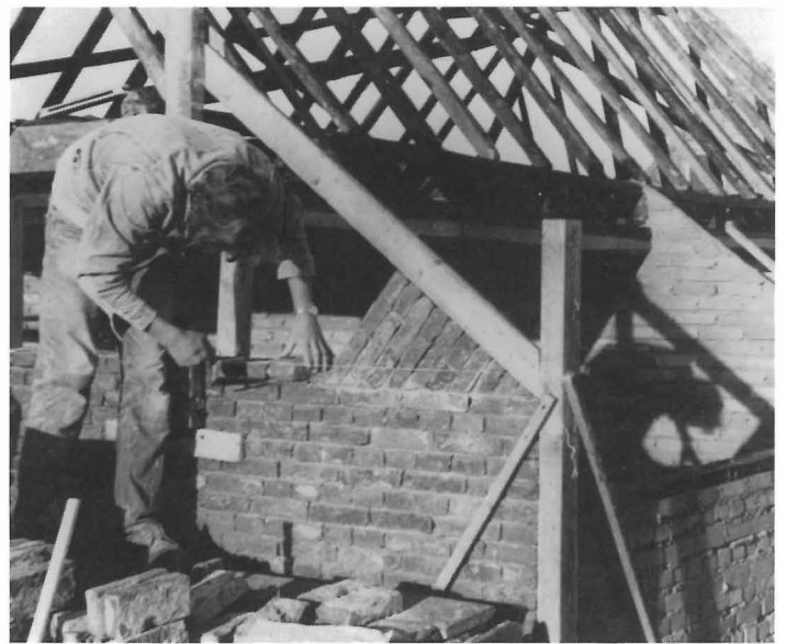
Het metselen van de vlechtingen in de voorgevel van het pandje uit Moddergat, 1973.

De panden op het Buitenmuseum werden in de oorspronkelijke kleuren geschilderd. Daartoe werd van ieder huis een documentatie aangelegd van de aangetroffen kleuren, zodat de schilder de juiste kleuren kon mengen, 1979.