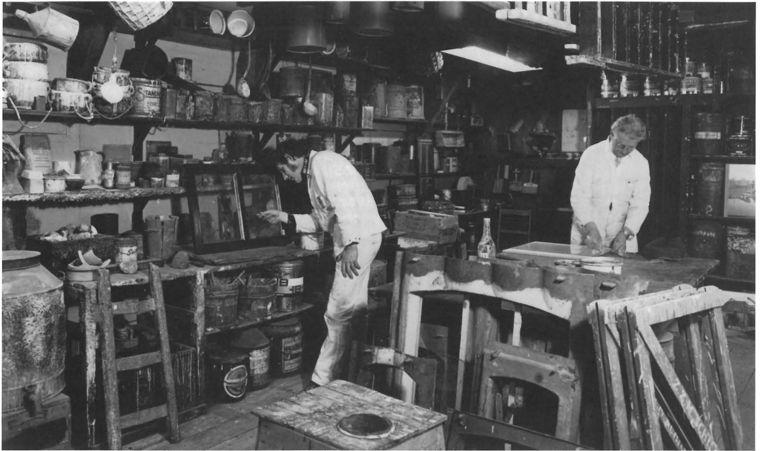
In de schilderswinkel van het Buitenmuseum mengden de museumschilders de verven en voerden zij kleine schilderwerken uit, 1979.

De panden op het Buitenmuseum werden in de oorspronkelijke kleuren geschilderd. Daartoe werd van ieder huis een documentatie aangelegd van de aangetroffen kleuren, zodat de schilder de juiste kleuren kon mengen, 1979.