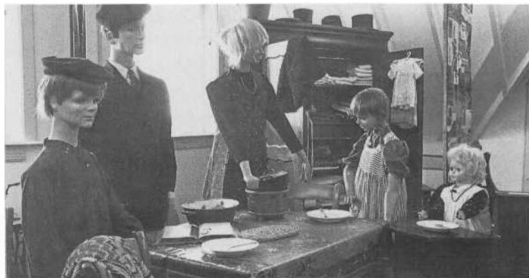
Uitbeelding van het gezinsleven in Genemuiden omstreeks 1900.