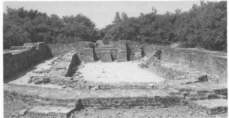
Boven: Voormalige Hervormde kerk van Schokland, thans onderdeel van het museumcomplex.