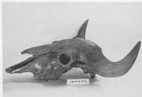
Schedel van een steppewisent.

In de geologische afdeling van het museum trekken vooral de zwerfstenen, die door de voorlaatste IJstijd naar deze regio zijn gebracht, de aandacht. Verder bevindt zich in het museum een omvangrijke collectie erratica, dat zijn zwerfstenen, die ver verwijderd van de gesteenten, waarvan zij deel uitmaakten, worden