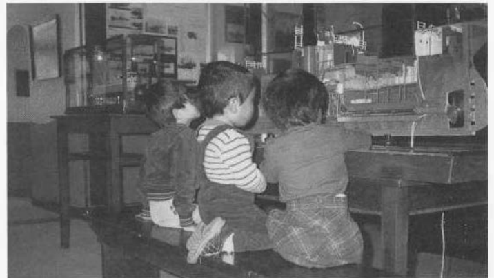
Rechts: De loodsenkamer in het museum.