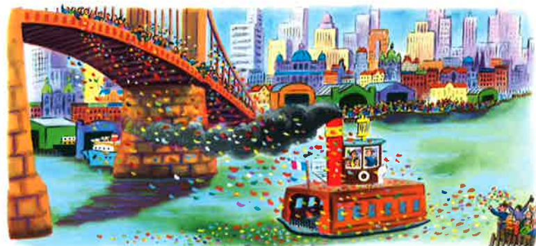
■ Illustratie uit Christoffel en de Columbus, Tibor Gergely, 1951