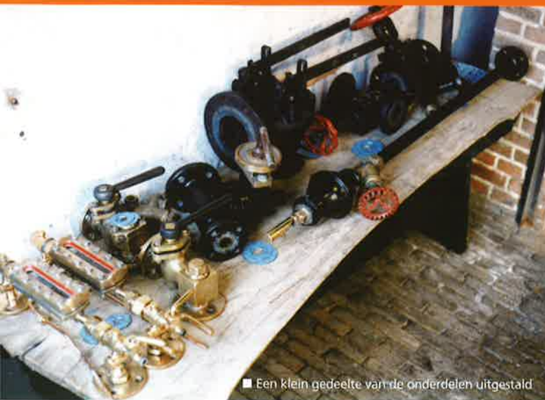
■ Een klein gedeelte van de onderdelen uitgesteld