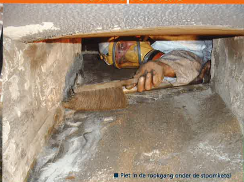
■ Piët in de rookgang onder de stoomketel

zomaar opkomen. Dan moet er iemand hulp kunnen bieden. Daarnaast kan Jenne ook mooi de stofzuiger bedienen waarmee ik as opzuig," zegt Piet lachend. "Daarvoor gebruik ik natuurlijk een speciale stofzuiger. Ook draag ik een speciale overall en heb ik een masker met luchtfilter op. Aan alle veiligheidsmaatregelen is gedacht. Naast het onderhoud aan de ketel en machine komen er ook zomaar weer onverwachte onderhoudspuntjes om de hoek kijken. Zo kwam ik er kort nadat het seizoen was afgelopen achter dat de palen waar de fijn-/wolwasser op staat helemaal verrot waren. Die moesten dus vervangen worden. Gelukkig hebben we timmermannen in huis. Ik heb ze gevraagd of ze voor nieuwe palen willen zorgen."