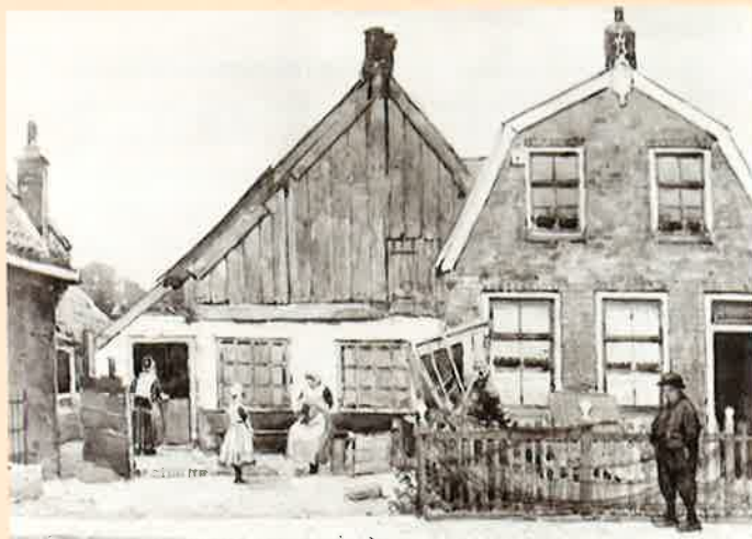
■ Traditionele houten visserswoning en moderne stenen woning op Urk. Aquarel door C. Vreedenburgh, 1930. Collectie Zuiderzeemuseum.

In de tweede helft van de 19e eeuw stonden de Urker vissershuizen schots en scheef op de top en de flanken van de Urker bult. Een rooilijn was er nauwelijks te ontdekken. Er is wel eens gezegd dat de bebouwing op een Neurenberger speelgoeddoos leek. In de 20e eeuw werd het dorp uitgebreid met talloze nieuwe woningen die een meer geordende ligging kregen. Ofschoon op het uiterlijk van deze nieuwe huizen regelmatig kritiek is geuit – ze zouden karakterloos zijn en geen aansluiting hebben bij de oude bebouwing – waren ze wat ruimtegebruik en hygiëne betreft een grote vooruitgang. Zo maakten bijvoorbeeld aparte slaapkamers op de verdieping een einde aan het slapen in bedompte bedsteden, iets wat in oude visserswoningen nog lange tijd zeer gebruikelijk was. De 20e-eeuwse woningbouw-architectuur mag zich trouwens door de inven-