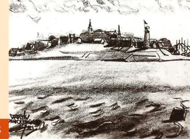
De westzijde van het hoge deel van Urk, gezien vanuit zee. Houtskooltekening door M. Monnickendam, 1931. Collectie Zuiderzeemuseum.

De vorm en omvang die Urk aan de vooravond van de aanleg van de Noordoostpolder had, lag in de 18e eeuw reeds in grote lijnen vast. Ook de verdeling van het eiland in een hoog zuidwestelijk deel (de bult) en een laag noordoostelijk gebied was al geruime tijd een gegeven. Het hoge deel kende van oudsher bewoning, het lage niet. Tot in het midden van de 19e eeuw waren de huizen van de eilandbewoners aan de luwe zijde van de Urker hoogte gesitueerd. Vanaf het moment dat het eiland in 1819 een echte haven kreeg, schoof de bebouwing over de bult heen. Ondanks de snelle groei van de bevolking bleven de Urkers wonen op het hoge deel van hun eiland. Alleen hier waren ze zeker van droge voeten tijdens perioden van storm of hoog water. In 1930 was de bult overbevolkt geraakt en woonden in vele huizen meerdere gezinnen. Het spreekt vanzelf dat het aanzien van Urk door de alsmaar toenemende bebouwing in de loop van de tijd veranderde.