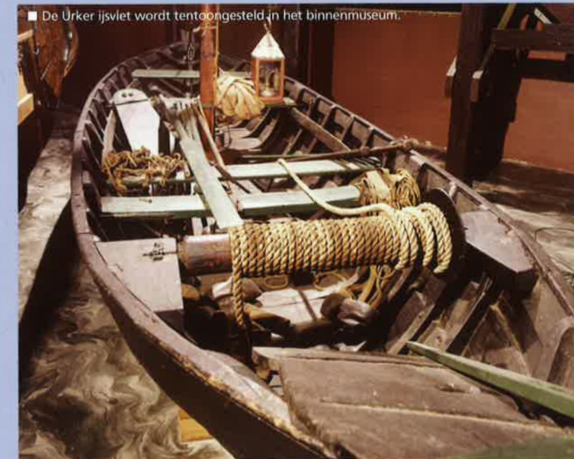
De Urker ijsvlet wordt tentoongesteld in het binnenmuseum.