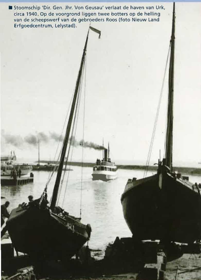
Stoomschip 'Dir. Gen. Jhr. Von Geusau' verlaat de haven van Urk, circa 1940. Op de voorgrond liggen twee botters op de helling van de scheepswerf van de gebroeders Roos.

Reeds in de 19e eeuw vroeg het samenleven van een grote groep mensen op een kleine oppervlakte om maatregelen die problemen in de kiem smoorden of sancties oplegden aan hen die zich weinig sociaal gedroegen. Vanaf 1834 zijn er politieverordeningen bekend, die aangeven wat er volgens het gemeentebestuur wel en niet op Urk