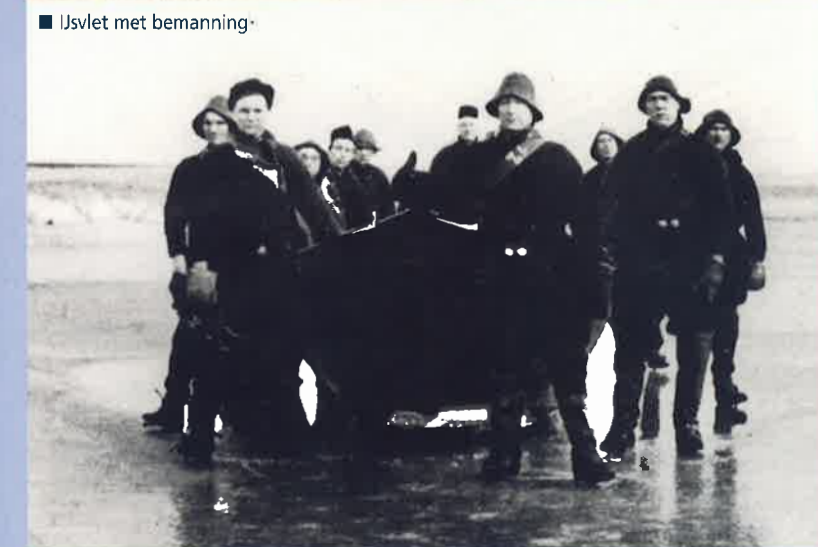
Ijsvlet met bemanning.

religie verminderde ook als thema van gesprekken en lectuur. Kranten en radio verruimden onmiskenbaar de gezichtskring van de eilandbewoners. Jongeren schaamden zich soms zelfs voor traditionele religieuze uitingen. Een bijeenkomst van jonge Zuiderzeewerkers werd bijvoorbeeld zonder gebed geopend, omdat sommige aanwezigen vreesden door hun collega's uitgelachen te worden.