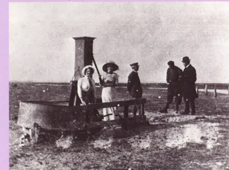
De 'moderne' waterpomp

Een andere prentbriefkaart geeft meer onbedoeld een kijkje in het leven van alledag. Hij toont hoe benauwend dicht de huizen op elkaar stonden. Wantoestanden in de volkshuisvesting, zouden we nu zeggen. Maar destijds ging het eerder om het aardige makelaartje op de punt van het dak. Daarop attendeert ook de beschrijving door een museummedewerker uit het verleden. Het is maar wat je wilt zien. Er staat ook een gedrukte tekst op de ommezijde van de kaart: "Bezoekt het typische, schilderachtige eiland Urk". Dat schilderachtige, daar ging het om.