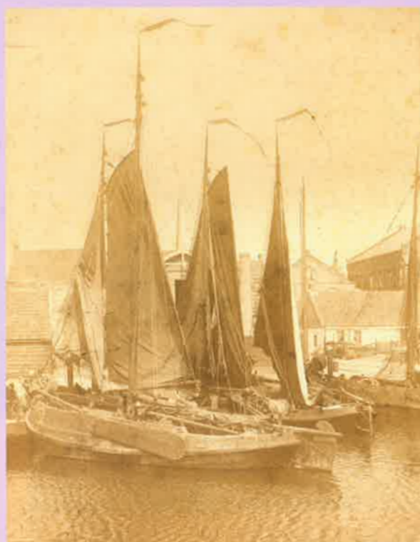
Haven van Urk

Dit jaar bestaat de presentatie "Levende geschiedenis Urk 1905" - voor wie het spel mee speelt - 100 jaar, en dat is de aanleiding geweest voor extra aandacht. Daarom zijn deze zomer 22 foto's over Urk tussen 1895 en 1915 te zien in het tentoonstellingspand Zoutkamp. De selectie van de foto's is bepaald door het thema beeldvorming. Wat vertellen de foto's over de manier van kijken van de fotograaf? En wat over ons eigen beeld van Urk?