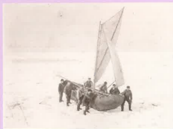
De Ijsvlet onderhield in de winter het contact met de vaste wal

Op Marken leek het oorspronkelijke Nederland bewaard gebleven. Het gaat hier om een Europees verschijnsel: het zoeken naar gebieden die de authentieke nationale identiteit belichamen. Men vond ze in landelijke, met de natuur verweven en in de historie verankerde regio's. Wat hier voor Marken is beschreven, geldt ook voor Volendam en voor het gebied rond de Zuiderzee als geheel. En stellig ook voor Urk. Geleerden en andere bezoekers benadrukten de afgeslotenheid van dit eiland. Zij waren, zo schrijft Geurts in zijn onlangs verschenen boek, gefascineerd door de bijzondere natuurlijke gesteldheid van Urk en de authenticiteit die de bevolking uitstraalde. Zij beschouwden het eiland en zijn bewoners inderdaad als een bewaard gebleven oorspronkelijk stukje Nederland.