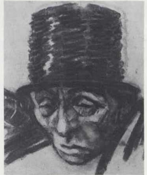
Voorstudies in houtskool voor het grote schilderij De begrafenis van een visser.