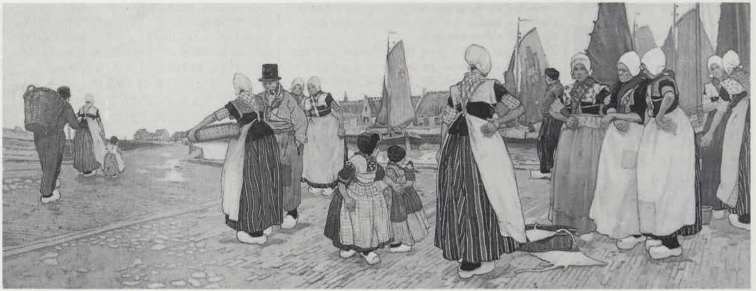
Hendrik Cassiers, de haven van Bunschoten.

de markt, tegen een boom zit een kind kousen te breien en twee pijprokende mannen (40 x 100 cm);