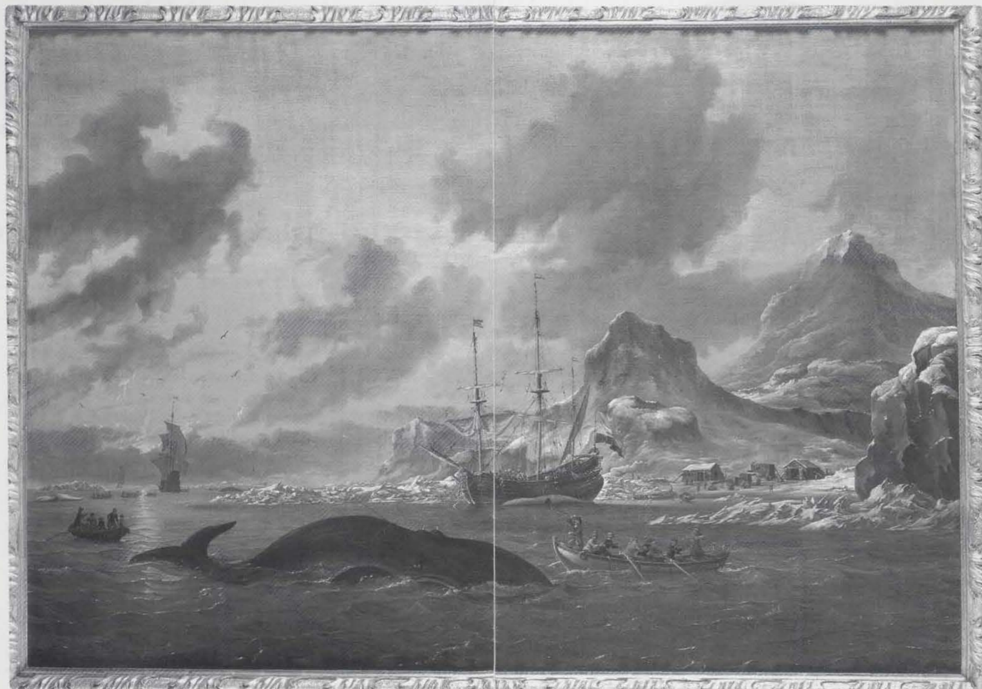
Walvisvangst bij de kust van Spitsbergen, Abraham Storck, omstreeks 1690, olieverf op doek, 118 bij 167,5 cm.

In de 17de en de 18de eeuw zijn talrijke schilderijen geproduceerd met voorstellingen van de walvisvangst. Vaak werden deze taferelen gecombineerd met beelden van nevenactiviteiten die in het poolgebied door de zeevarenden werden uitgevoerd, zoals de jacht op walrussen of ijsberen. De