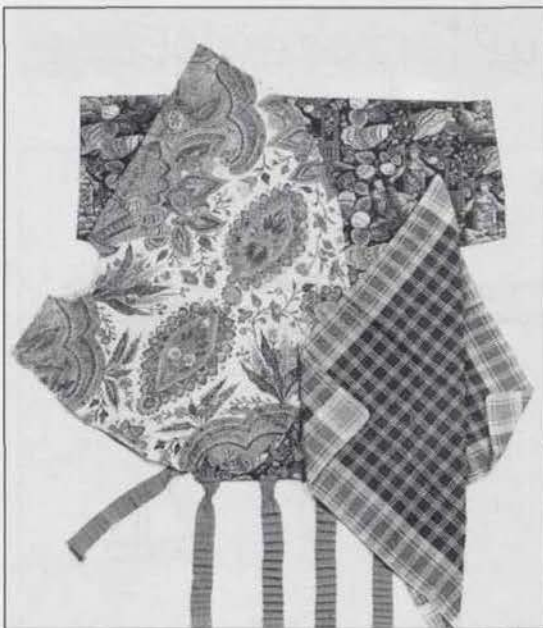
Particulieren hebben het Zuiderzeemuseum een wikkelleed, een sitsen voering van een Friese zonneboed en een halsdoekje geschonken.

Veel bekende wikkelleeden zijn van Indiase sits gemaakt. Dit kleed is echter vervaardigd van een Engelse of Franse blokdruk. Beide zijden zijn van dezelfde stof gemaakt. Tussen de beide lagen bevindt zich waarschijnlijk nog een stof, maar dat is niet vast te stellen zonder de stiksels los te maken. Het kleed is met een groene draad vierkant doorgestikt, zoals een gestikte deken. Op een donkerbruine ondergrond zijn zowel mensfiguren als bloemen en schelpen te zien. De overheersende kleuren zijn hiervan geel met roodbruin, de blaadjes zijn geel met groen. Hier en daar is wat blauw verwerkt. Het patroon is verspringend op het textiel aangebracht om een rythmische variatie aan te brengen in het zich repeterende motief. Het blok waarmee gedrukt is, is 22 bij 22 centimeter. Op de afbeelding staat een man bij een een gestyleerd huisje met in zijn hand een hangend dienblad waarop twee bekers staan. Kennelijk biedt hij deze bekers aan aan twee figuren waarvan er één steunend op zijn linker arm voor hem ligt. Het andere figuurtje is waarschijnlijk een kind. Het uiterlijk van deze mensfiguren is duidelijk chinees. Het gaat hier om zogenaamde chinoiserieën die aan het eind van de 18de eeuw in de mode kwamen, en tot ver in de 19de eeuw populair bleven. Dat zijn westerse weergaven van Chinese kunst, waarbij illustraties uit reisverslagen als inspiratiebron dienden.