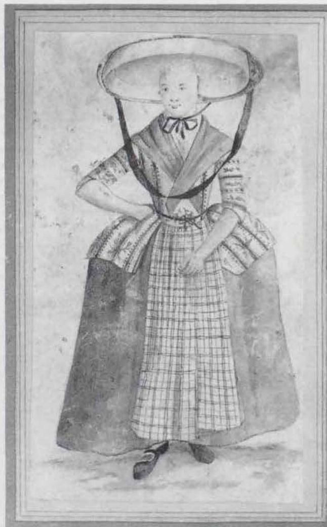
Deze Friese boerin draagt de zogenaamde Duitse muts en een zonnehoed gevoerd met sits. Anonieme aquarel uit omstreeks 1800.

De voering van de Friese zonnehoed is van sits met grote bloemmotieven op