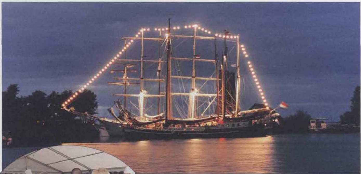
Voor de gelegenheid is de driemaster Stedenmaeght van de Hanzestad Compagnie getooid met feestverlichting.