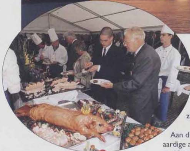
Een heerlijk buffet voor alle gasten wordt geserveerd in het Peperhuis.

in onze Schepenhal staat), het ruime zeesop. Het 'ruige zeemansleven', zoals u het - volgens een krant uit die tijd - zelf uitdrukte, sprak u wel aan.