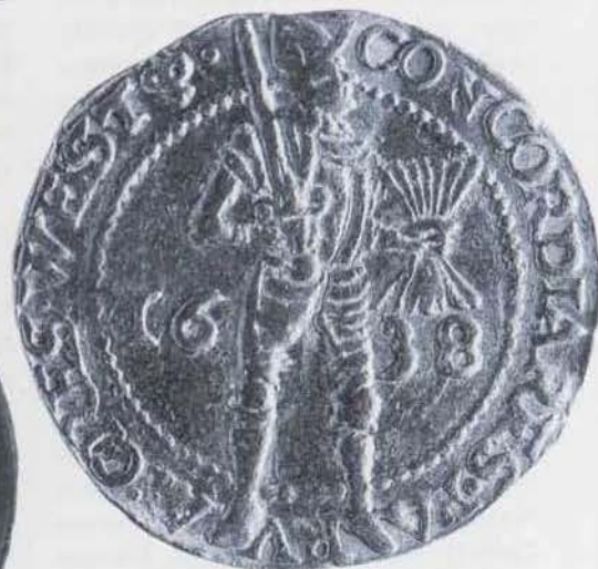
De deelcollectie munten en penningen is in 1998-1999 beschreven; zo ook deze exemplaren.