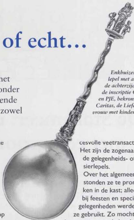
Enkhuizer lepel met aan de achterzijde de inscriptie GSZ en PJE, bekroning Caritas, de Liefde, vrouw met kinderen.

De lepels variëren in vorm, afhankelijk van de tijd en het gebied waarin ze gemaakt zijn. Het Enkhuizer type is uniek