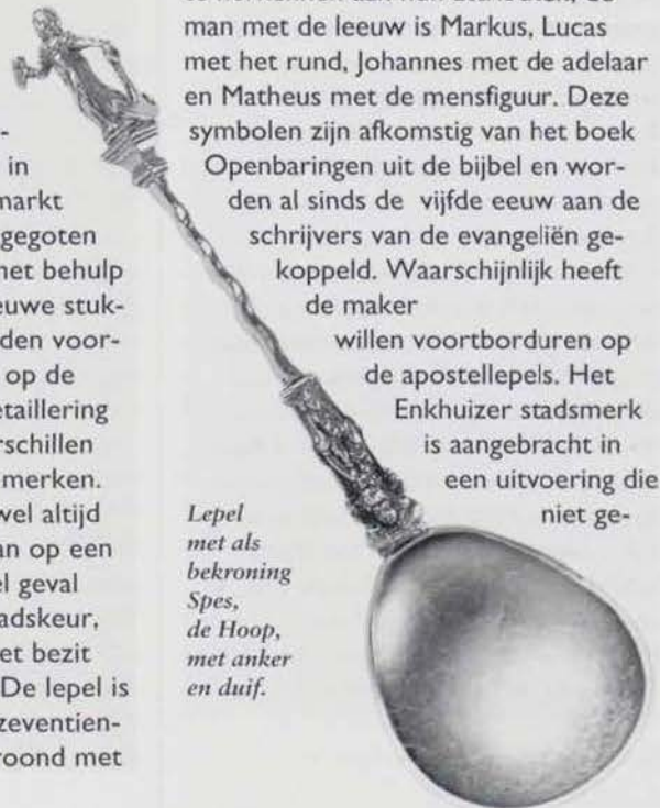
Lepel met als bekroning Spes, de Hoop, met anker en duif.

willen voortborduren op de apostellepels. Het Enkhuizer stadsmerk is aangebracht in een uitvoering die niet ge-