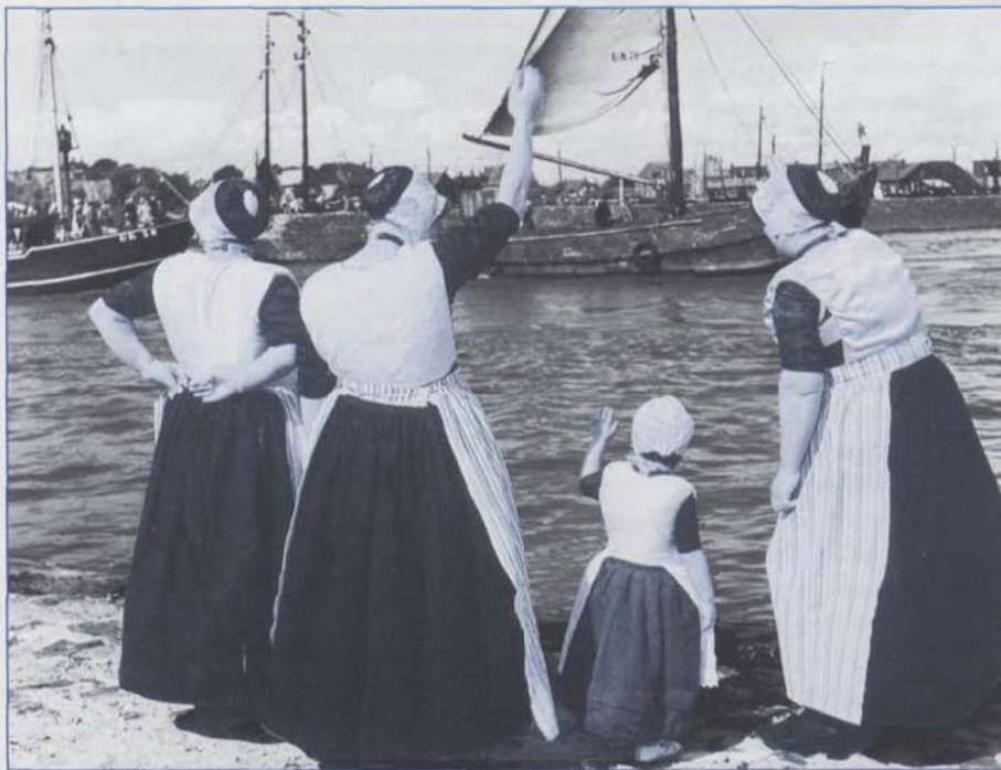
Urk door Eli van Zachten. Collectie Maria Austria Instituut te Amsterdam.

E ens ging de zee hier tekeer, maar die tijd komt niet weer. Zuiderzee heet nu IJsselmeer'. Deze regels uit de Zuiderzeeballade geven de essentie weer van de fototentoonstelling 'Altijd zee gebleven'. Ondanks deze overgang van zout naar zoet water en de veranderingen aan land heeft het IJsselmeer wel de charme en uitstraling van een zee weten te behouden. Vandaar de titel. De foto's zijn geselecteerd aan de hand van de boeken 'De Zoete Zee' van auteur Cherry Duyns en uit 'Holland zonder haast' met foto's van Henk Jonker, die veel in Enkhuizen heeft gewerkt. Ze komen uit het fotoarchief Maria Austria Instituut te