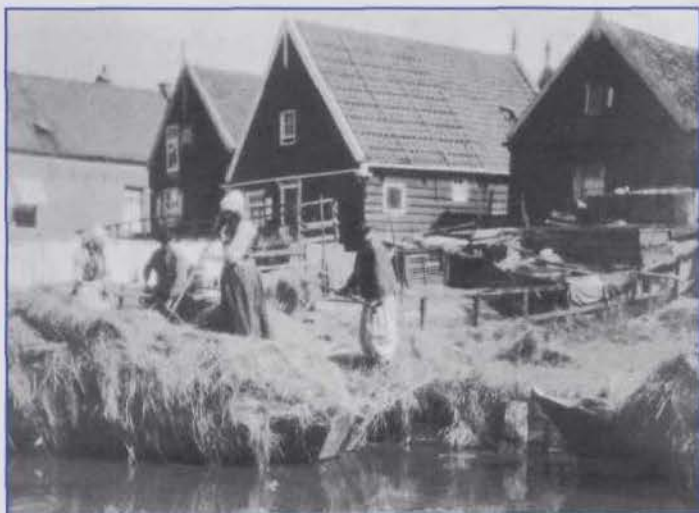
Hooioogst op Marken.

staat nu vooral bekend als een schilderachtig fotograaf. Hij maakte zijn foto's echter niet als een aanklacht tegen de armoede.