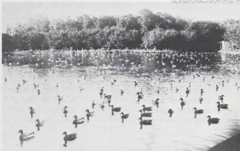
De kooiplas van de eendenkooi op Wieringen.

Het lokken van de eenden naar de vangpijp begint achter het scherm vlak naast de monding van de pijp. Van daaruit heeft de kooiker een goed overzicht op de "wilde eenden" die op de kooiplas en de oevers zitten. Ze zijn daar gekomen dankzij de zogenaamde vliegstaaleenden. Dat zijn eenden die de kooiplas als een soort veilige thuishaven zien, waar