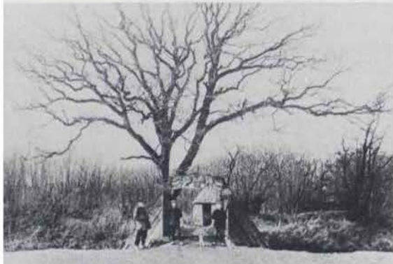
De ingang van de Mulderskooi op Wieringen met op de achtergrond het zeventiende-eeuwse kooikershuisje.