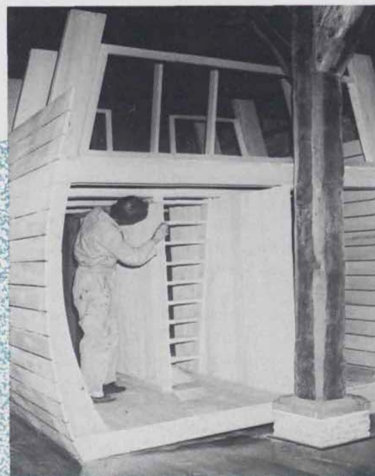
De laatste maanden is er hard aan de inrichting van het binnenmuseum gewerkt. Hier wordt de laatste hand gelegd aan de scheepsromp die een centrale plaats inneemt in de walvisvaarttentoonstelling.

de straatzijde. De bestaande beveiliging beschermde het museum tegen onbevoegd binnentreden. De nieuwe beveiliging gaat veel verder en geldt als een van de meest geavanceerde beveiligingssystemen in Nederlandse musea. Het ontwerp valt op door de geringe inzet van personeel die benodigd is. Het publiek zal er weinig van merken... althans, zolang men zich als een keurig bezoeker gedraagt. In het kader van de beveiliging kunnen de vitrines heel bijzonder worden genoemd. Zij zijn ontworpen en geleverd door Glascom B.V. uit Naaldwijk die geldt als de "hofleverancier" voor de