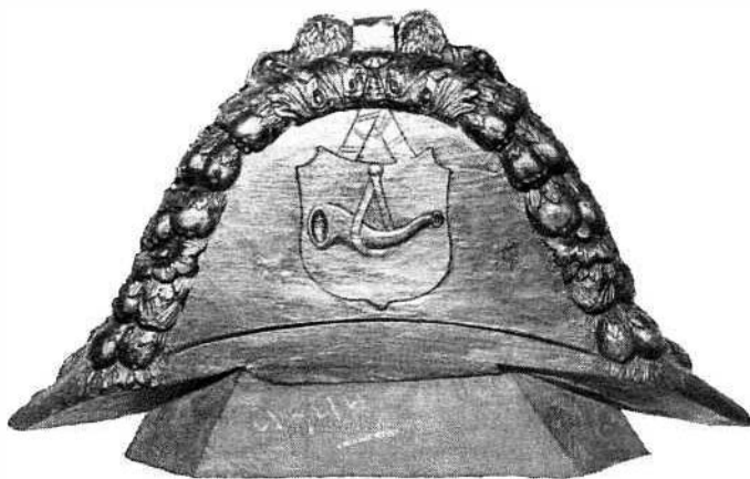
Hakkebord van een hektjalk.