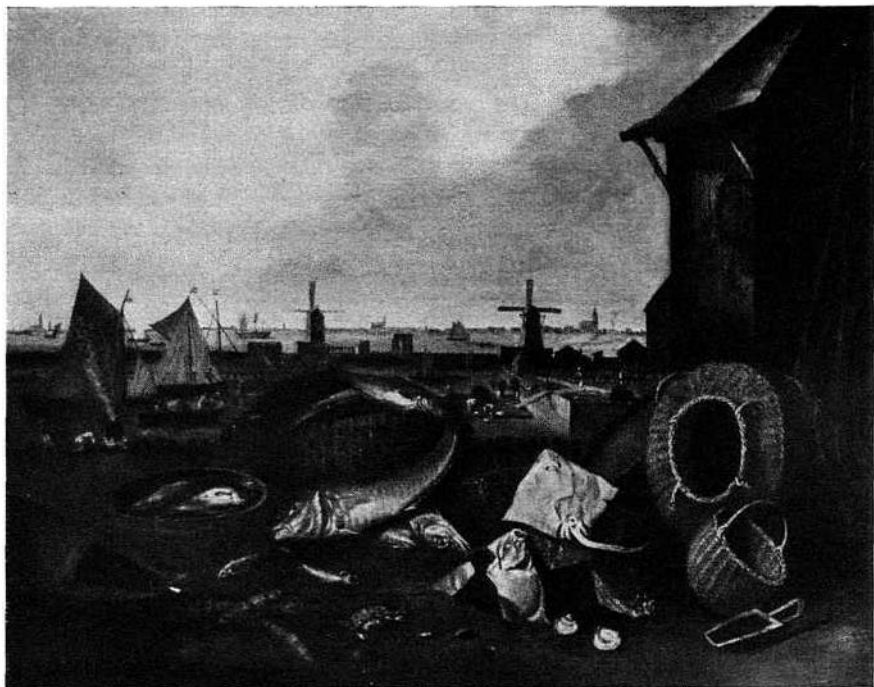
M. Withoos. „Visserijbedrijf te Hoorn”

vrouwen op een vlotje haar was spoelen in het havenwater. Achter een tweetal tussen palissaden oprijzende molens zien wij uit over het druk bevaren Hoornse Hop met in het verschiep de kerktorens van daaraan gelegen dorpen.