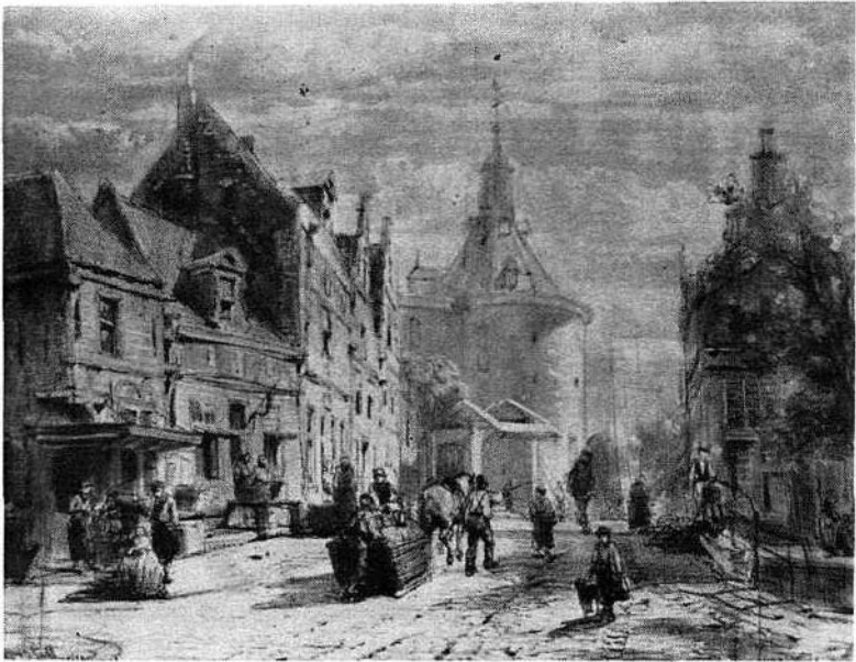
C. Springer, „Het Zuiderspuis te Enkhuizen“