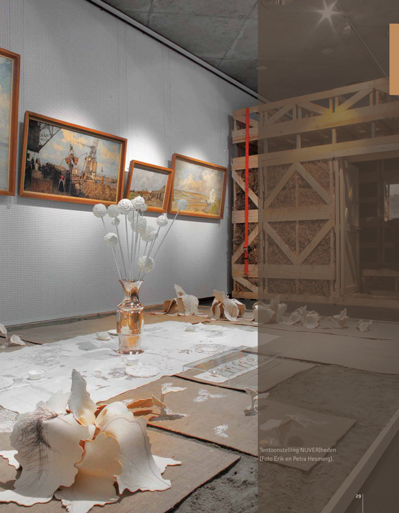
Afb. 3 Tentoonstelling NIJVER|heden (Foto Erik en Petra Hesmerg).