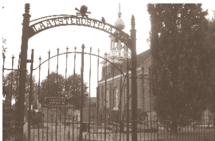
afb. 3 Kerkhof bij het Kerkje aan Zee

Teksten van deze aard komen op de grafzerken van dit kerkhof relatief meer voor dan op de grafzerken van andere christelijke begraafplaatsen buiten Urk, die ik heb bezocht. Mijn verklaring hiervoor is, dat de Urker bij zijn werk op zee afhankelijk is van de elementen en daarom direct met de dood geconfronteerd wordt. Het verlossende werk van Jezus Christus is daarbij zijn enige troost in leven