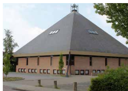
afb. 6 Maranathakerk, 12 mei 2011