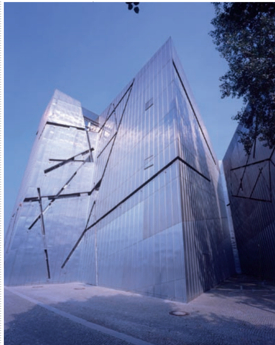
Joods Museum, Berlijn