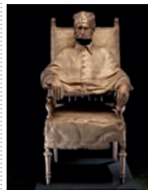
Croon Davidovich Advocaten