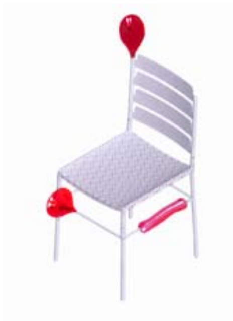
Links, van boven naar beneden: Butte, Knopstoel