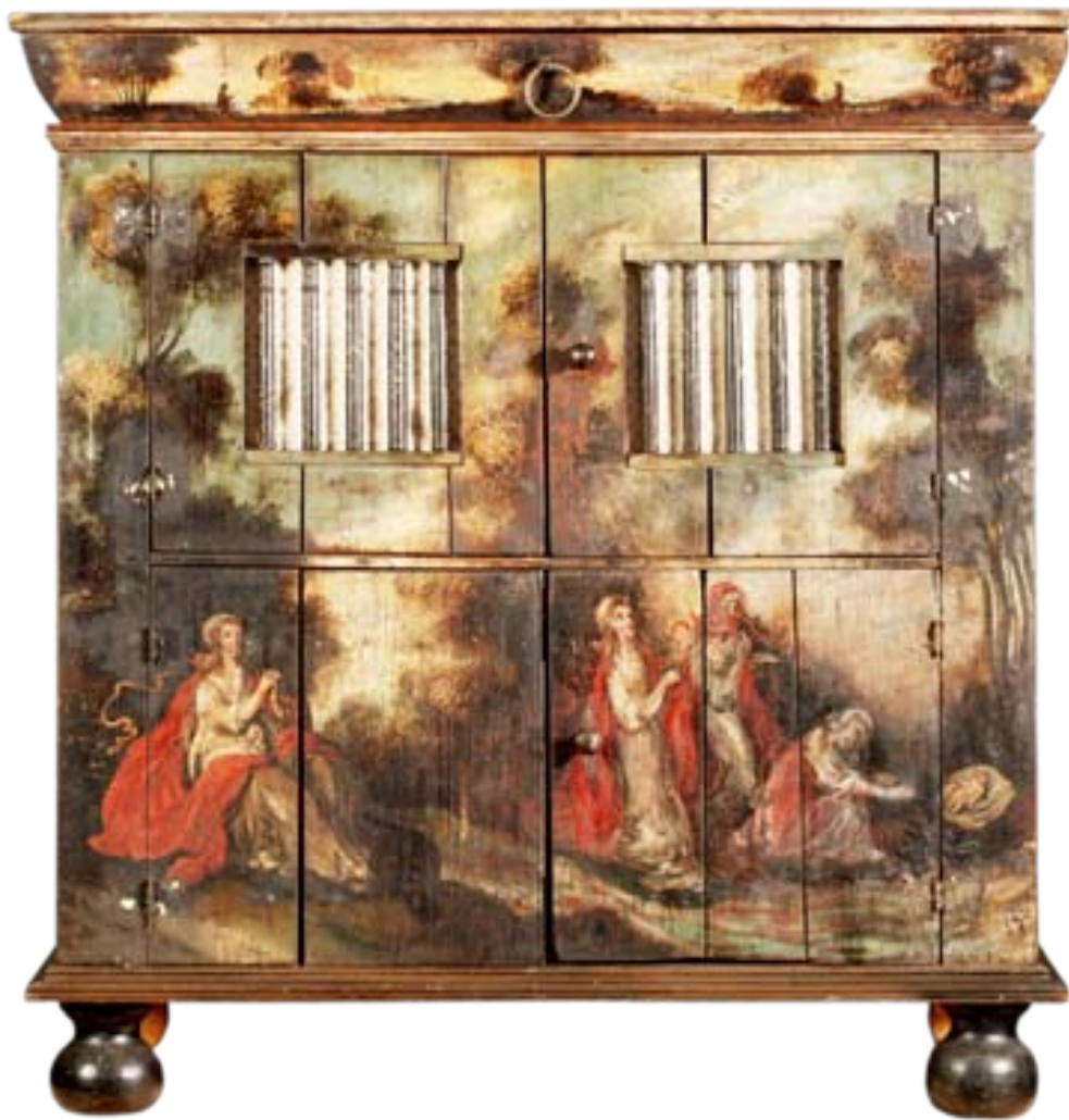
Land of water, jaargang 3 (maart 2009) pag. 130 135