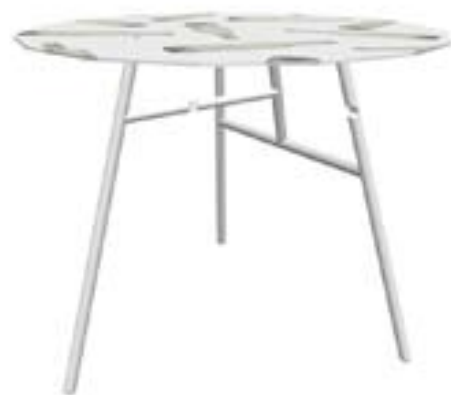
Links, van boven naar beneden: Hangoortafel, Flap-aan-de-wand