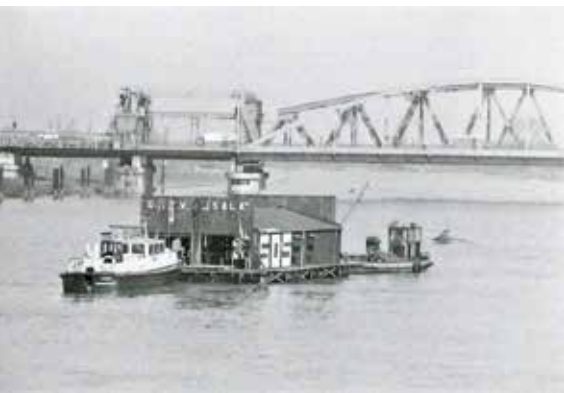
Het botenhuis wordt over de IJssel versleept naar de Noorderhaven.

11 april – De Roei- en Zeilvereniging Isala verkeert in nood. Woensdagochtend werd dat nog eens heel duidelijk toen de leden de botenhuisen over de IJssel van het Cabinetje naar de Noorderhaven transporteerden. Het SOS, dat in levensgrote letters op de zijkant van het botenhuis was aangebracht, is eigenlijk een beroep op het gemeentebestuur om zo snel mogelijk de helpende hand te bieden. De plaats waar Isala thans is onderbracht, achten de watersporters allesbehalve ideaal. Men vreest dan ook dat deze – hopelijk zeer tijdelijke – huisvesting vervelende gevolgen zal hebben voor het verenigingsleven.