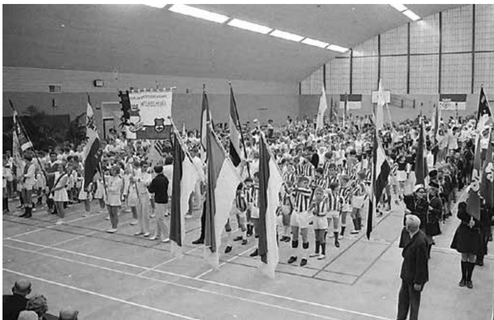
De vlaggenparade tijdens de openingsceremonie.

Het openingsprogramma begon 's middags om vijf uur bij het kantoor van de N.V. Utiliteitsbouw Sanders in Arnhem. Daarvandaan