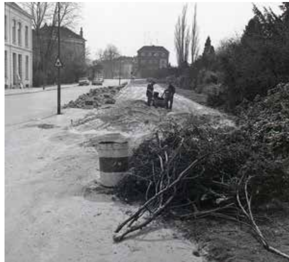
Het plantsoen moet wijken voor Hanzehal-parkeerders. (Musea Zutphen)

Parkeergelegenheid wordt eveneens gemaakt aan de Coehoorsingel tussen de Buitensoos en de Canadezenbrug en wel aan de zijde van de tuin van de soos. Ook hier kan men in de toekomst nogal wat auto's kwijt.